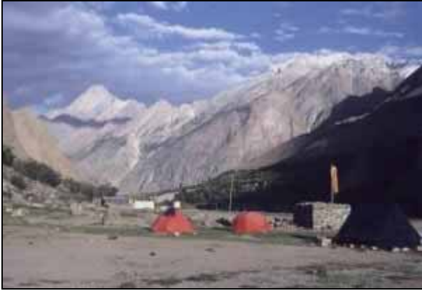
2003: Unser Camp in Askole

Hier ist auch die letzte Möglichkeit um frische Nahrungsmittel einzukaufen. Zwei Tage nach ihrer Ankunft trifft auch schon der Briefträger mit der ersten Post ein, die exakt einen Monat von Europa bis hierher gebraucht hat.