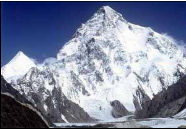
Ziel der Expedition: Der Chogori – K2 (8611 m)

Ziel der Expedition ist die Eroberung des Zweithöchsten Berges der Welt, den Chogori oder K 2 genannt, der mit seinen 8611 Metern die ganze Kette des Karakorum Gebirges überragt. Ein für die damalige Zeit kühner Plan, war das Gebiet doch noch ziemlich unerforscht. Die Gebirgskette im Norden Kaschmirs war für London von grosser Bedeutung, denn sie stellte eine Art Puffer dar, welche die indische Tiefebene von dem Zugriff der Chinesen und der Russen schützte. Die britische Survey of India war daher bestrebt das Gebiet zu vermessen um eine Karte zu erstellen. Capt. Montgomerie, Vermessungsoffizier, nahm sich dieser Aufgabe an und sichtete 1856 aus zweihundert Kilometer Entfernung im inneren Karakorum eine Zusammenballung hoher Gipfel, 1861 erforscht ein weiterer Vermessungsoffizier, Col. Henry Haversham Godwin-Austen, grosse Teile des westlichen Karakorums. Ihm ist die erste Beschreibung des Zuganges zum K 2 zu verdanken. Soviel über die Entdeckungsgeschichte.