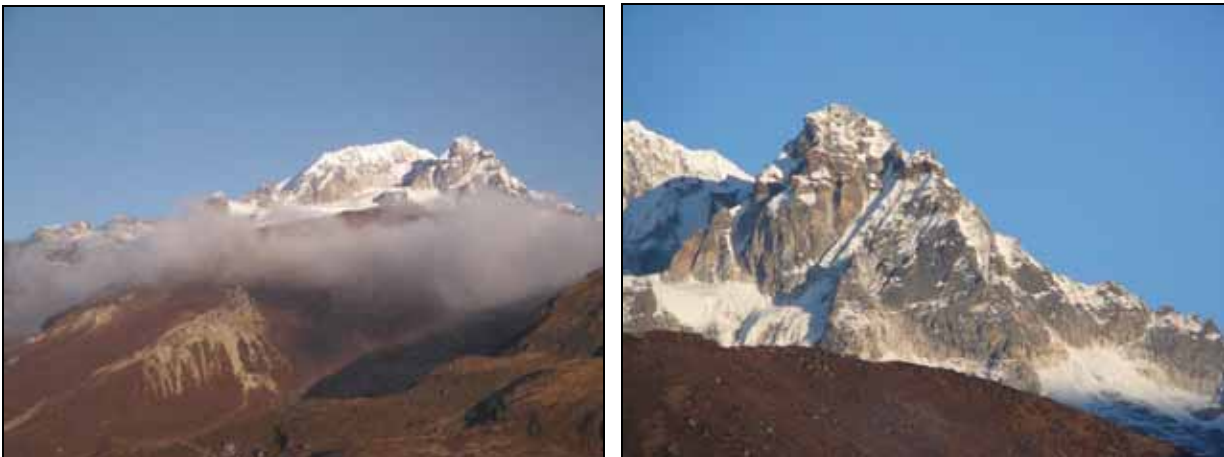
Der Frey's Peak (links davon der flache Gipfel des Koktang)

Wegen seiner Ähnlichkeit wird er im Volksmunde auch gerne das „Matterhorn von Sikkim“ genannt.