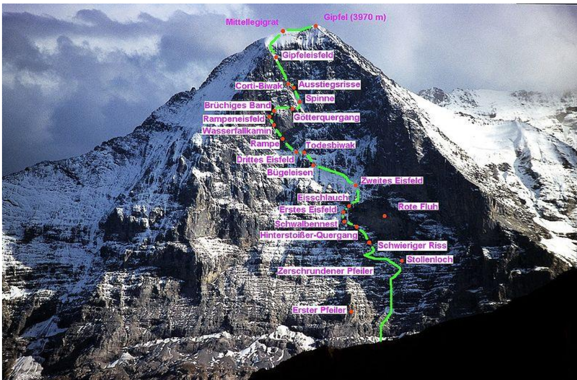
Die klassische Heckmair-Route

Die Eigernordwand gehört zu den schwierigsten Wänden der Alpen. Bekannt wurde sie vor allem durch seine dramatische Besteigungsgeschichte, bei welcher unzählige Menschen ums Leben kamen. Da die Wand wie in einem gigantischen Freilichttheater von der Kleinen Scheidegg einzusehen ist, lockte sie Schaulustige und die Medien um Besteigungen wie dramatische Rettungsaktionen mitzuverfolgen. Die Erstbesteigung glückte im Juli 1938 einer deutsch-österreichischen Seilschaft mit Anderl Heckmair, Ludwig Voig, Einrich Harrer und Fritz Kasperek, welche für den Durchstieg drei Tagen brauchten. Die dramatische Besteigung erzählte Heinrich Harrer in seinem Buch „Die weisse Spinne“, wodurch der Berg weltweit berühmt wurde.