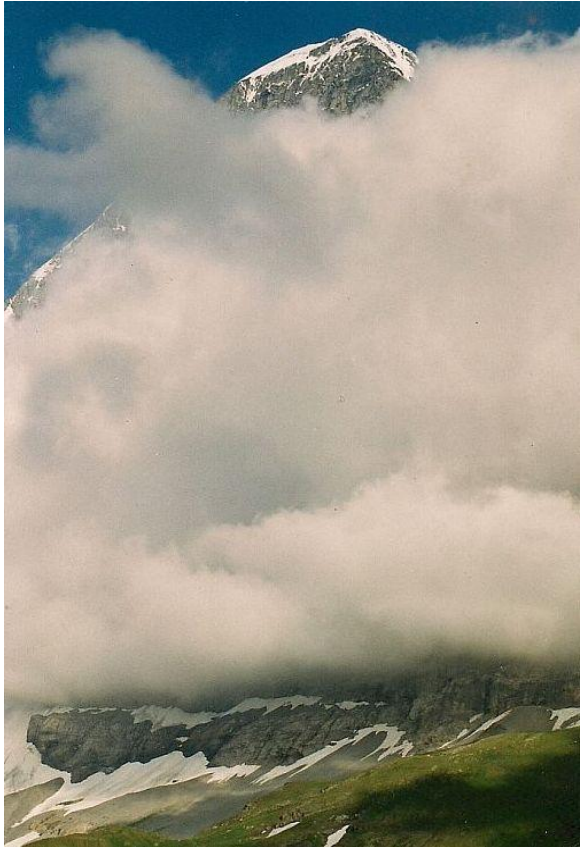
Wetterkapiolen am Eiger: innerhalb von Minuten ist die Wand im Nebel verhüllt...