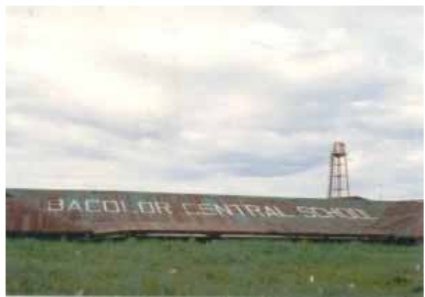
Die Dächer des Marktes und der Schule