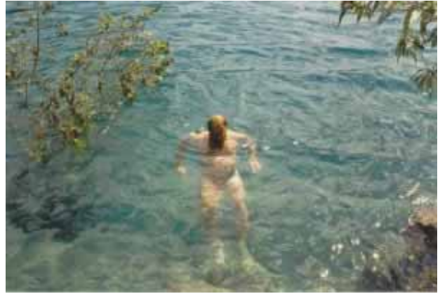
Der Autor am Kratersee und beim Baden