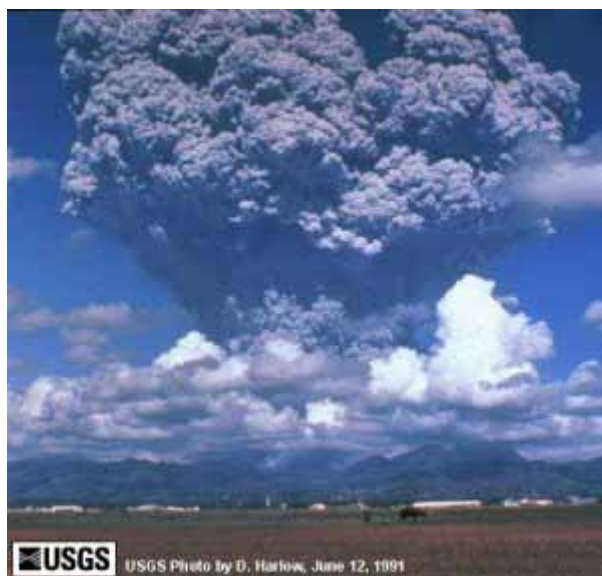
Der Aschenwolkenpilz