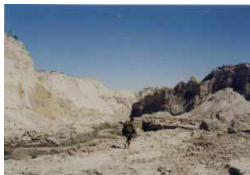
Unser Guide George