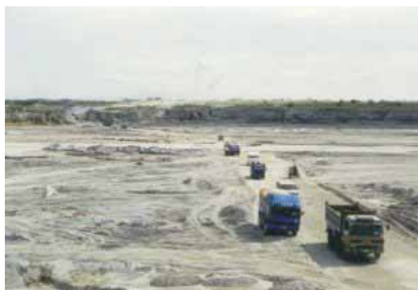
Der Porac Fluss

Als ob die Bevölkerung der Provinz Pampanga nicht schon genug durch den Ausbruch des Pinatubo im Juni 1991 gelitten hätte, kommt es in der Nacht vom 1. auf den 2. Oktober 1995 zu einer erneuten Katastrophe. Durch die heftigen Regenfälle (die Philippinen werden jedes Jahr von etwa 20 Taifunen heimgesucht) haben Laharlawinen in den Jahren nach dem Ausbruch von 1991 beinahe noch grössere Verwüstung angerichtet als der Ausbruch selbst. Die Bevölkerung am Fusse des Vulkans währte sich mit einem Frühwarnsystem und dem Bau eines 20 Meter hohen und 60 Kilometer langen Damms in U-Form entlang des Pasig-Potrero-Flusses in Sicherheit. Bis der Taifun „Mameng“ kam. Durch die heftigen Regengüsse läuft der Damm über und überschwemmt die tiefer gelegenen Gebiete. In der Nacht kommt es zur Katastrophe. Gegen 22.00 Uhr lösen sich von den 25 Kilometer entfernten Hängen des Pinatubo riesige Massen von Schlamm. Mit rasender Geschwindigkeit rollt die Schlammlawine ins Tal. Nichts kann sie aufhalten. George, unser Führer des Pinatubo-Treks, war in der Nähe, als es passierte: „Es war, als ob hunderttausend Pferde im Galopp vom Pinatubo daherkamen“ erinnert er sich, den Schrecken sichtlich noch in seinem Gesicht geschrieben. Innerhalb weniger Minuten werden Brücken, Dämme, ganze Dörfer von den Schlammmassen verschüttet.