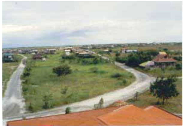
Bacolor: von 20'000 Häusern ist lediglich die Kirche übriggeblieben