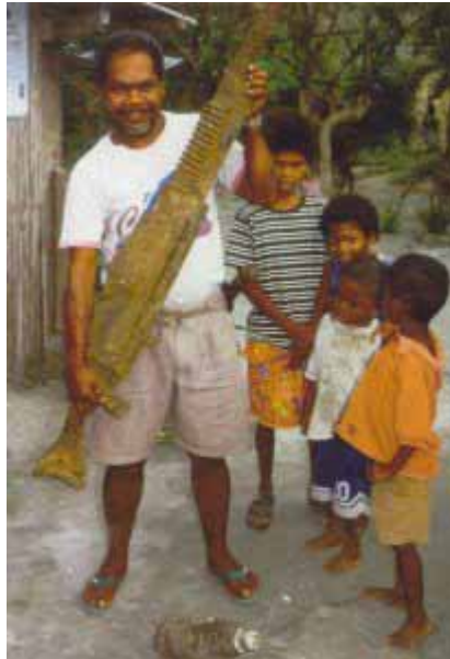
Japanisches Maschinengewehr aus dem 2. Weltkrieg