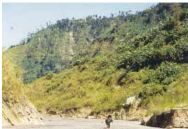
Hier beginnt das Trekking

Die Temperatur frühmorgens ist ziemlich frisch. Durch den Fahrtwind im offenen Jeepney, bin ich echt froh eine Jacke eingepackt zu haben. Langsam werden in der Morgendämmerung die Umriss des 1745 Meter hohen Pinatubos wahr. Seine Form ist derart untypisch, dass niemanden auf die Idee käme, dass es sich um einen Vulkan handelt. So ist es auch nicht verwunderlich, dass die meisten Leute vor dem Ausbruch von der Existenz eines Vulkans in ihrer unmittelbarer Nähe überhaupt keine Ahnung hatten. Während 600 Jahren hatte er friedlich dahingedöst, bis er im Juni 1991 in voller Wucht ausbrach. Vom letzten Checkpoint in Sta. Juliana fahren wir noch etwa 14 Km das breite, flache Flussbett des O'Donnel Rivers bis zur Aeta-Siedlung von Bangan Tungol hinauf. Ab hier beginnt der Trekk. 06.30 Uhr: unser Jeepney-Fahrer verabschiedet sich. Er wird uns morgen gegen Mittag hier wieder abholen.