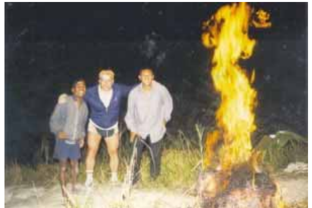
Abendstimmung und Lagerfeuer