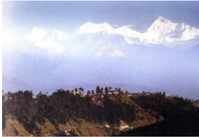
So wäre die Sicht auf den Kangchenzunga (8586 m) !