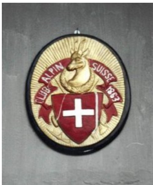
Über dem Eingang des Everest-Museums