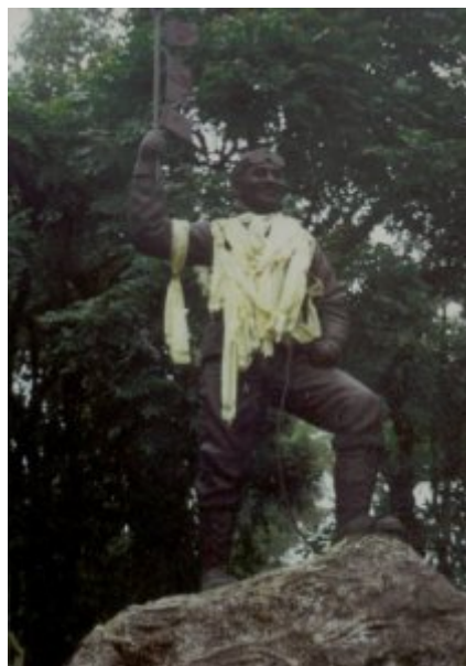
Everest-Museum und das Denkmal von Sherpa Tenzing Norkay im Nebel