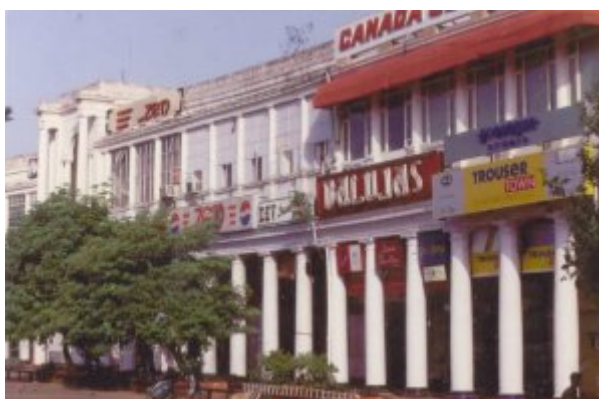
V.I.n.r Red Fort, Unabhängigkeitsdenkmal und Connaught Place