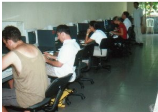
Internets in Angeles (Philippinen) und Saigon (Vietnam).