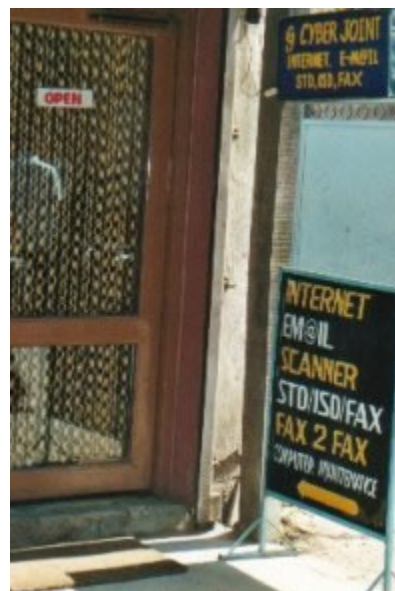
v.l.n.r Internets in Phnom Penh (Kambodscha), Vientiane (Laos) und Kathmandu (Nepal)