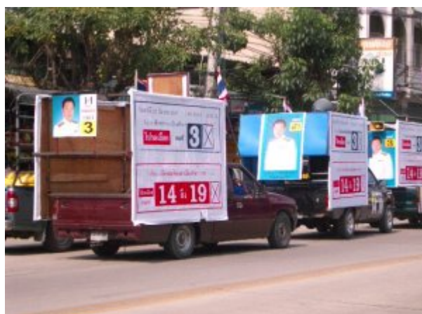
Wahlpropaganda in Thailand