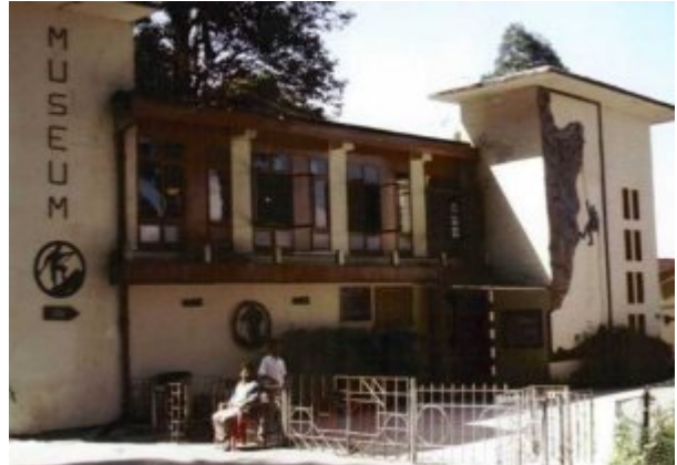
Himalayan Mountaineering Institute