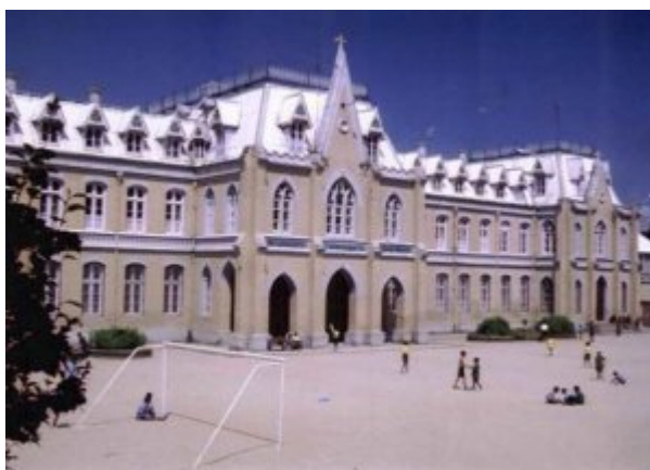
St. Joseph's College