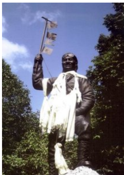
Denkmal von Sherpa Tenzing Norgay