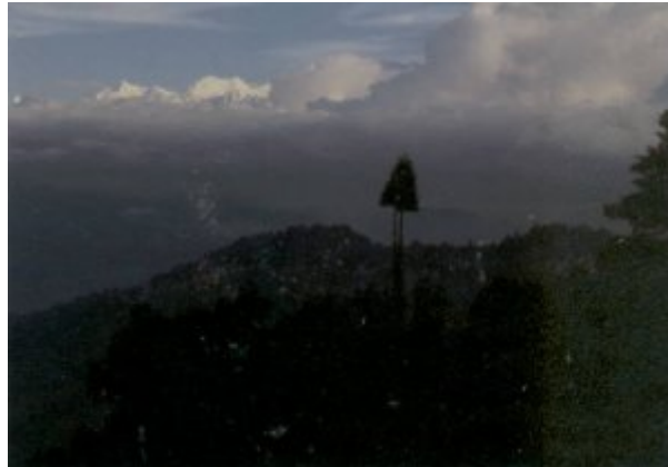
Es hellt auf!!