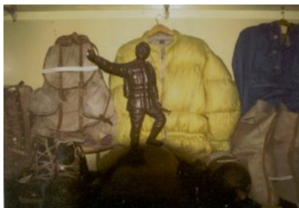
Ausrüstungsgegenstände der Everest-Expedition von 1953 mit Hillary/Tenzing