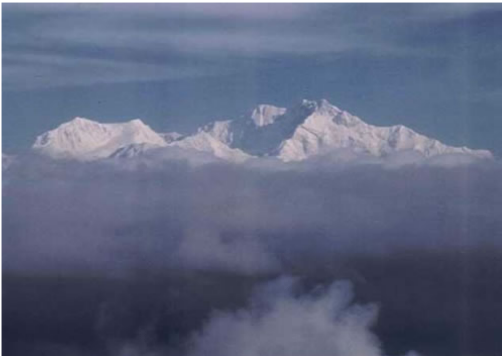
Endlich ist die Sicht frei! Kangchenzunga (8586 m)