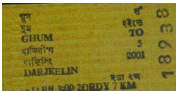
Ticket Ghum - Darjeeling