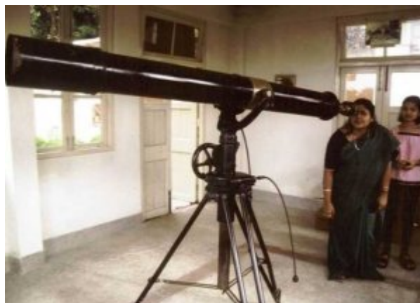
Carl Zeiss Teleskop