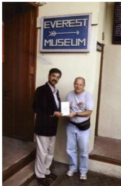
Übergabe der Videokassette