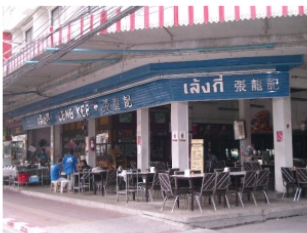
Restaurant Leng Kee: hier gibt die beste Tom Yam Gung