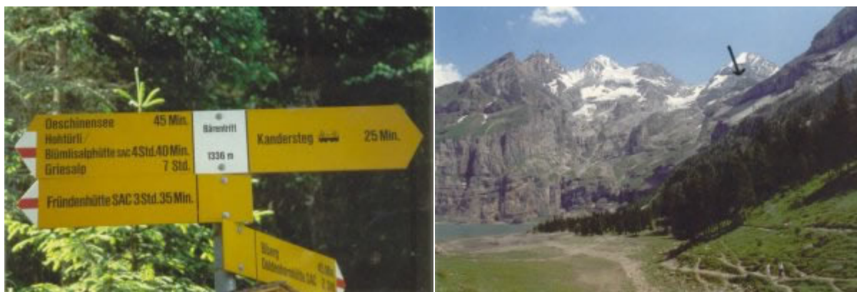
Blümlisalp und Fründenhorn. Auf dieser Kuppe liegt die Fründenhütte

Er herrscht reger Betrieb, wie an jedem schönen Sommertag. Zahlreiche Schulklassen sind hier auf der Schulreise und picknicken am Seeufer. Der Weg zur Fründenhütte führt rechts am See entlang. Zweieinhalb Stunden zeigt der Wegweiser an. Der Weg wird durch einige Bachbette unterbrochen. Langsam steigt es an. Der schmale Pfad führt über Baumwurzeln und Felsbrocken hinauf. Schon nach den ersten Kehren bin ich ausser Atem. Ich fühle mich kraftlos, torkle nur so über den Weg. Ich reisse mich zusammen. Zwei Kehren weiter oben lasse ich mich auf einem Stein nieder. Aus! Fertig! Schluss! Es hat keinen Sinn. Ich bin enttäuscht. Enttäuscht, dass mein bisheriges Fitnessstraining scheinbar überhaupt nichts gebracht hat. Fünfzehnmal war ich doch jeweils 50 Minuten mit dem Velo in coupiertem Gelände unterwegs, insgesamt dreizehn Stunden Training. Alles für die Katze! Wie soll ich so mein Trekking in Pakistan nur überstehen? Dort muss ich täglich Marschzeiten zwischen vier und acht Stunden zurücklegen. Und dazu kommt noch die Höhe, es geht auf über 5000 Meter! Mein Traum den K2 und die drei anderen Achttausender zu sehen ist wohl ausgeträumt. Aber einfach so aufgeben? Nein, das darf man doch nicht. Wer ein Ziel im Leben erreichen will muss dafür hart kämpfen. Ich bin im Dilemma: Aufgeben oder jetzt erst recht das Training verdoppeln? Ich habe ja noch etwas Zeit bis zu meinem Abflug zurück nach Asien. Vorerst bin ich jedoch zwei Tage ausser Gefecht.