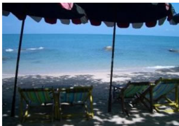
Die Beach von Wongamat, auch "Little Germany" genannt