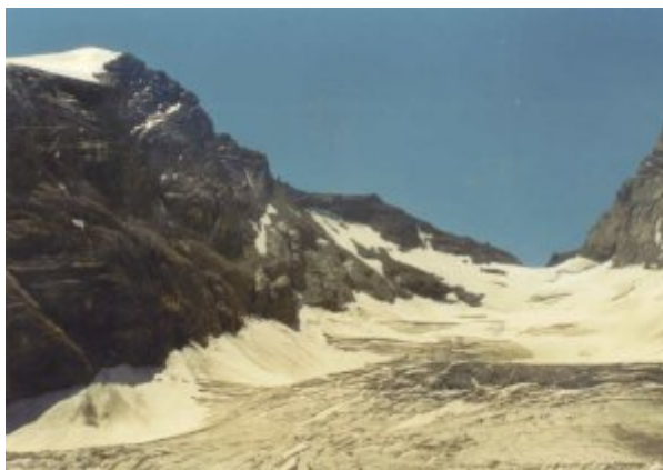
Fründenjoch, links das Fründenhorn

Ich bin seit meiner Kindheit von dieser Hütte einfach begeistert. Vielleicht liegt es daran, dass mein Grossvater dabei war als sie gebaut wurde. Die Lage auf dieser Felskuppe, oberhalb des Fründengletschers gelegen, ist denn auch fantastisch. Geradeaus liegt das Fründenjoch. Rechtherhand erkennt man den imposanten Galletgrat der zum Gipfel des Doldenhorn führt. Links strahlt der Schneefirn des Fründenhorns in der mittäglichen Sonne. Weiter links ragt der Gipfel der Blümlisalp heraus an dessen Flanken die Zunge des Blümlisalpgletschers herunterhängt. Eine Menge Leute sind auf der Terrasse versammelt und verfolgen mit Ferngläsern die Berggänger unterwegs zu den Gipfeln. Nach der Mittagsrast steige ich ab.