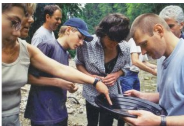
Gespannt verfolgen wir das Auswaschen

Von Stefans Erklärungen gescheitert geworden, mache ich mir meine eigenen Überlegungen, wo sich wohl der beste Goldpfad befinden könnte. Für meine erste Pfanne begeben wir uns flussabwärts. Das Schaufeln von Kies ist recht mühsam. Das Bachbett ist mit grossen Steinen übersät. Ich fülle die Pfanne mit drei Schaufeln Kies. Jetzt heftig schütteln. Das grobe Kies und die grösseren Steine kommen sofort an die Oberfläche. Eintauchen, schütteln, eintauchen, mehrmals wiederhole ich diesen Arbeitsvorgang. Wie Stefan uns erklärt hat, wasche ich die oberste Schicht aus. Ich wiederhole diesen Vorgang, bis nur noch wenig Sand übrig geblieben ist. Der Sand ist hell. Ein schlechtes Zeichen. Effektiv, ich kann hinschauen wie ich will, nichts das aus meiner Pfanne glänzt. Na, dann versuchen wir es noch einmal. „Bingo!, Bingo!“ tönt es inzwischen von weiter oben. Freudestrahlend wie ein