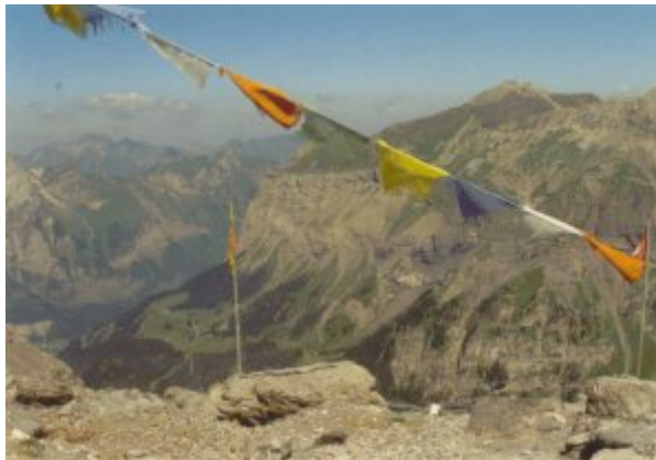
Blick ins Kandertal

Ich bin seit meiner Kindheit von dieser Hütte einfach begeistert. Vielleicht liegt es daran, dass mein Grossvater dabei war als sie gebaut wurde. Die Lage auf dieser Felskuppe, oberhalb des Fründengletschers gelegen, ist denn auch fantastisch. Geradeaus liegt das Fründenjoch. Rechtherhand erkennt man den imposanten Galletgrat der zum Gipfel des Doldenhorn führt. Links strahlt der Schneefirn des Fründenhorns in der mittäglichen Sonne. Weiter links ragt der Gipfel der Blümlisalp heraus an dessen Flanken die Zunge des Blümlisalpgletschers herunterhängt. Eine Menge Leute sind auf der Terrasse versammelt und verfolgen mit Ferngläsern die Berggänger unterwegs zu den Gipfeln. Nach der Mittagsrast steige ich ab.