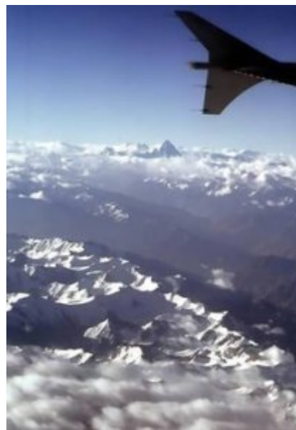
K 2 (8611 m) - Die schwarze Pyramide am Horizont