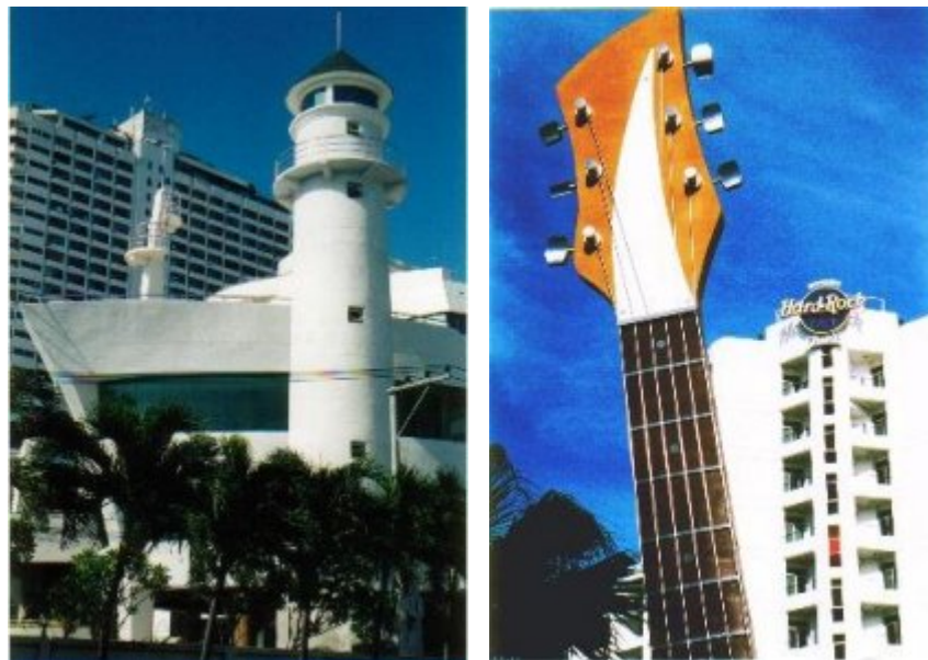
links: das neue Cruise Hotel - rechts: Hard Rock Hotel

Um die Fortschritte nach meinem Fründenhütte-Training nicht wieder gänzlich zu verlieren, laufe ich jeden morgen früh in meinen Bergschuhen auf den Hügel des Big Buddha. Zwei Stunden hin und zurück. Immerhin, besser als nichts. Mein Fussgelenk macht mir dabei keine Probleme, aber das linke Knie! Obwohl die Ärzte bei der letztjährigen Kontrolle, trotz Röntgen und MRI, nichts Abnormales gefunden haben, verspüre ich wieder dieses leichte Stechen an der Knieinnenseite. Ob ich vielleicht nicht gescheiter schon jetzt meine erste Reitstunde nehmen sollte?