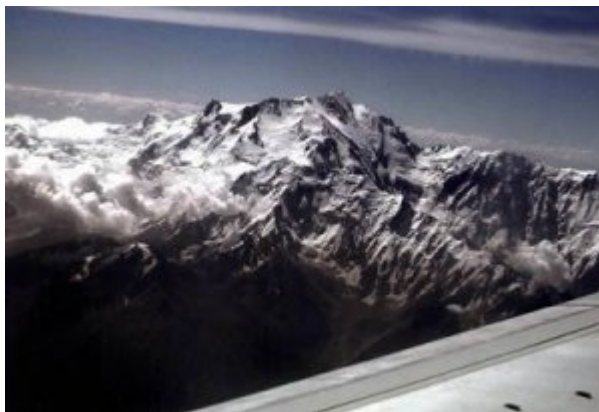
Der Nanga Parbat (Diamir Seite)

Ich habe kaum Zeit das Frühstück einzunehmen, schon rückt ein Schneekoloss ins Blickfeld. Das kann nur der Nanga Parbat sein. Heute fliegen wir ihn von Süden an. Im Gegensatz zu Gestern strahlt die Diamirflanke heute im Sonnenlicht.