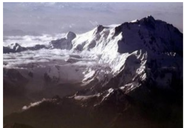
Bild links: K 2 und Chogolisa - Bild rechts: Nanga Parbat (Raikhot Seite) im Morgenlicht