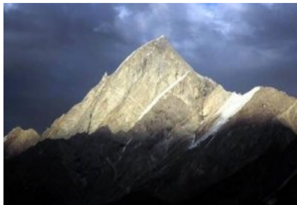
Bild links: Unser Camp in Askole - Bild rechts: Mango Gusor (6288 m)