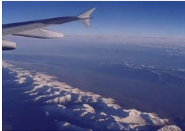
Bergkette in China

Haifisches die aus dem Wasser ragt! Welcher Gipfel wird das wohl sein? Es könnte der Chogolisa sein! Die Sicht auf die Berge wird in der morgendlichen Sonne immer fantastischer. Wir überfliegen die zahlreichen 7000er der Hunza Region. Fünf Minuten später kommt die ganze Pracht des Nanga Parbat aus 10'800 m Höhe in Sicht. Der Berg ist zum berühren nahe. Die Raikhot-Seite mit dem 8125 m hohen Hauptgipfel ist von der Sonne hell beleuchtet. Die Südseite, die Diamir-Flanke, liegt noch im Schatten. Mensch, war das ein Auftakt. Ein gigantisches Flugenerlebnis. Kurz vor der Landung in Islamabad lässt sich der Steward mit Passagieren fotografieren und schüttelt jedem dreimal die Hände. „Das Flugzeug ist mein Zuhause und jedermann ist herzlich willkommen“ meint er zu mir. Eine so nette, freundliche Flugbegleitung habe ich bisher noch nie erlebt.