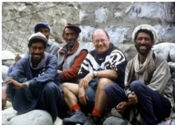
Mittagspause bei der Jhola-Brücke