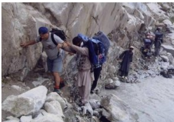
Die heikle Passage