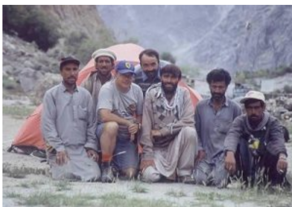
Zurück in Askole Camp