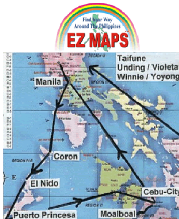
Meine Reise zu den Kawasan-Wasserfällen in Moalboal