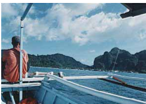
Fahrt zurück nach El Nido