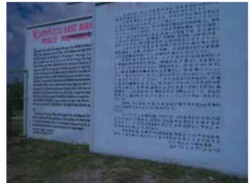
Hier, am östlichen Flugfeld wurden die Kamikaze-Todesflieger gegründet