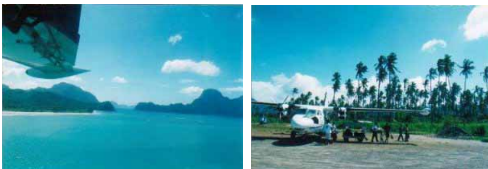
Der Anflug von El Nido

Zwei deutsche Pärchen, einige Filipinos und ein Kampfhahn im Werte von 80'000 Pesos steigen aus, vier neue Passagiere steigen für die restliche Strecke nach El Nido zu. Wir erreichen die Nordspitze von Palawan. Diesmal sitze ich leider auf der falschen Seite. Zähneknirschend keine Aufnahmen machen zu können, blicke ich durch die kleinen Fenster auf meiner linken Seite und erhasche zwischendurch den Silberstreifen der Küste. Auch die Landung in El Nido ist ein kleines Erlebnis. Der Anflug erfolgt von der See her. Das Wasser unter uns kommt immer näher: 10 Meter, 5 Meter, 2 Meter, 1 Meter! Gibt es etwa eine Wasserung? Sekundenbruchteile später setzt der Pilot auf der Landepiste inmitten von Kokospalmen auf.