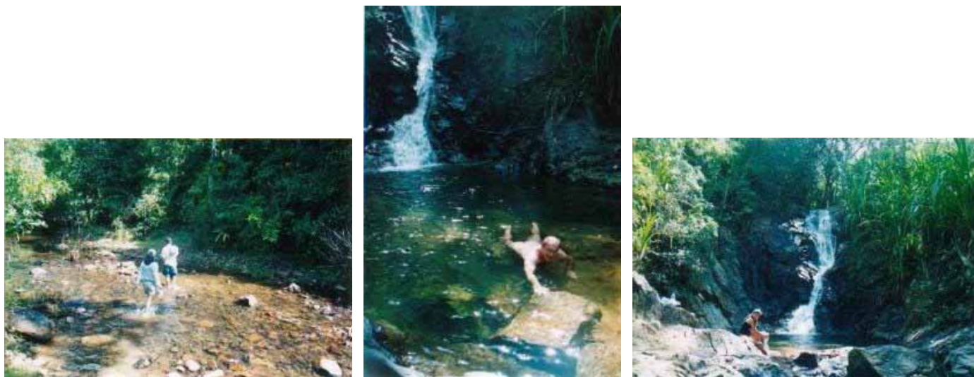
Nasse Füße und das erfrischendes Bad im Wasserfall