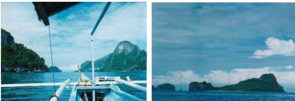
Bild links: rechts im Bild, Cadlao Island - Bild rechts: Helicopter island

Für 400 Pesos kann man sich bei der Judith im Artcafé einer Bootstour anschliessen (Minimum 4 Personen). Wer alleine ein Boot chartern will wie wir, bezahlt im Lally-Abbet Tausend Pesos für eine Tagestour. Nach wenigen Minuten tuckern wir an der vorgelagerten Insel Cadlao vorbei. Versteckt hinter den zahlreichen Buchten kommen einladende weisse Sandstrände zum Vorschein. Vor uns liegt die Helicopter-Island. In der Ferne, durch den Dunst kaum voneinander zu trennen, die lang gezogene Matinloc-Island und links davon die Miniloc-Island auf welche wir zusteuern.