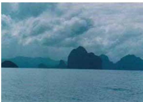
Weiterfahrt zur Insel Simizu