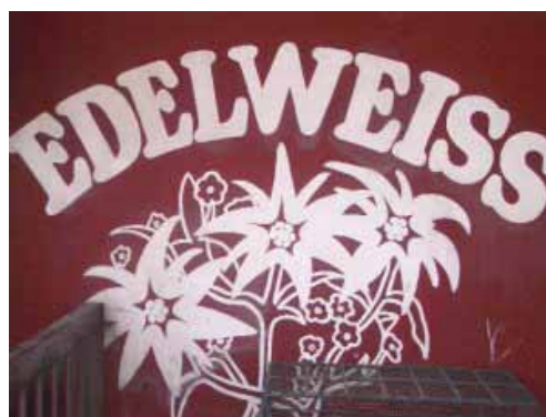
Zwei gute Adressen für Auslandschweizer