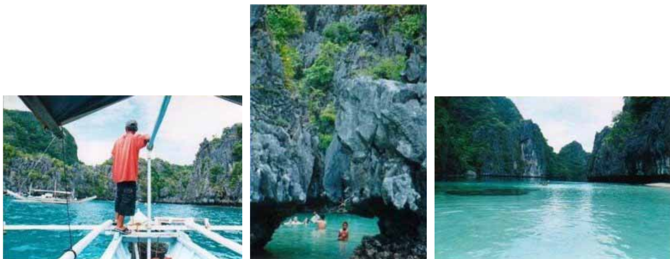
Bild links: Einfahrt in die kleine Lagune - Bild mitte: das Tunnel - Bild rechts: die grosse Lagune

Die See ist ruhig. Zwischen den schroffen Kalksteinfelsen führt ein Einschnitt zu einer herrlichen Lagune, die Small Lagoon. Eingangs davon wird der Bootsmotor abgestellt und das Boot gleitet in einer immensen Ruhe lautlos über das kristallklare Wasser. Leider sind die Korallenbänke bereits sehr stark beschädigt, dennoch ist das Schnorcheln inmitten der zahlreichen bunten Fische der Plausch. Einige Fische sind sehr frech und beissen mich in den Oberschenkel! Durch einen Tunnel schwimmen wir in die hintere Lagune. Herrlich wie die Felsen rund um uns steil aus dem Wasser aufragen, einfach sagenhaft! Wir tuckern weiter. Am Miniloc Island Resort vorbei, auch keine billige Anlage, geht's nördlich zur Big Lagoon, die grosse Lagune. Leider bedeckt sich der Himmel immer mehr und es beginnt sogar leicht zu regnen. So ein Pech! Dass wir ausgerechnet beim Insel-Hüpfen keinen schönen Tag erwischt haben, ärgert mich. Gestern war es doch noch so schön. Die grosse Lagune ist noch eindrücklicher. Da Ebbe herrscht, muss das Boot im Eingang ankern. Zu Fuss geht es entlang der rechten Seite ins Innere der Lagune.