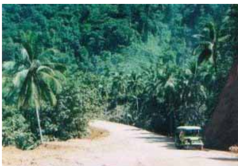
Fahrt an die Corong Bay

Von den zahlreichen möglichen Ausflügen ist das Island Hopping (Insel-Hüpfen) die grosse Attraktion. Die Bucht von Corong-Corong sowie die Wasserfälle sind weitere Tagesziele, die mit Mountainbikes unternommen werden können. Es gibt in El Nido auch Luxusanlagen wie etwa diejenige von Lagen Island. Eine Übernachtung kostet dort US $ 356! Ist so was nicht ein Blödsinn? Mich würde das Geld reuen, nicht so die zahlreichen Koreaner.