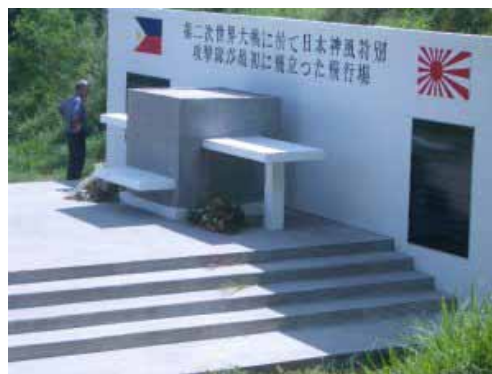
Die Angriffe starteten vom Mabalacat West Airfield