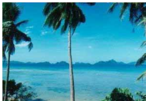
Die Corong Bay