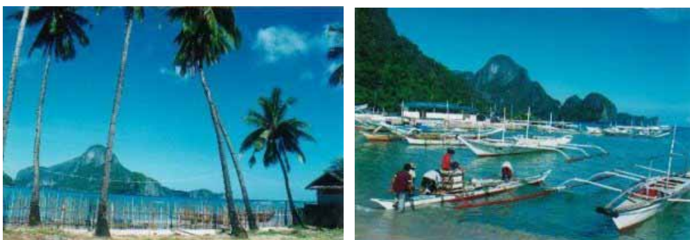
Die Bucht von El Nido mit der vorgelagerten Insel Cadlao

Der Flughafen liegt etwa fünf Kilometer ausserhalb der Stadt. Trikes bringen die Passagiere für 150 Pesos auf der holprigen Naturstrasse Strasse ins Bungalow. El Nido ist ein niedliches, sauberes, verschlafenes Nest. Das Städtchen liegt in einer schönen Bucht im Schutze eines Berghügels gelegen, hinter welchem sich die Sonne bereits kurz nach 16.00 Uhr verabschiedet. Die Temperatur wird dadurch etwas erträglicher, dafür gibt es leider keine Sonnenuntergänge! Der Bucht vorgelagert steht die Cadlao Island, die grösste und höchste Insel des Bacuit-Archipels.