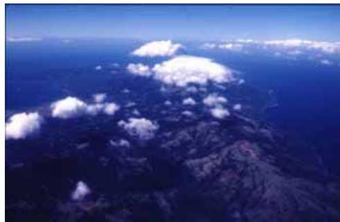
Flug über die Insel Mindoro

Unser Flug hätte uns eigentlich von Manila direkt nach El Nido bringen sollen, doch wer in den Philippinen reist, muss ständig auf Änderungen gefasst sein. So ging es nicht mit dem Flug DG 465, sondern mit DG 563 mit Zwischenlandung auf der Insel Busuanga! Für einmal habe ich hierzu nichts einzuwenden, im Gegenteil, die Gegend um Coron ist nämlich ein weiterer Geheimtipp, vor allem für Taucher. Nach weiteren zwanzig Minuten kommen die ersten Inseln ins Blickfeld. Ob ich vielleicht sogar eine der 25 Giraffen auf Calauit Island erkennen kann? Ja, es gibt hier einen Wildpark mit Zebras, Antilopen und Giraffen, welche während der Marcos-Zeit aus Afrika eingeflogen wurden. Die Inselgruppe der Calamin ist jedoch zu gross und für mich unmöglich aus dem Flugzeug unsere genaue Position zu erkennen. Wir fliegen immer tiefer über einer hügeligen Landschaft. Demnächst werden wir wohl landen, aber wo ist das hier überhaupt möglich? Als ob vor vielen Jahrtausenden ein Trax am Werk gewesen wäre, erstreckt sich zwischen zwei Hügelketten eine topfliche grüne Ebene, in dessen Mitte sich der rostrote Streifen der Landebahn hervorhebt. Wir sind in Busuanga gelandet. Von der traumhaften Lage von Coron ist hier oben auf dem Plateau leider nichts zu sehen. Macht nichts, ich komme bestimmt nochmals in dieses traumhafte Gebiet zurück.