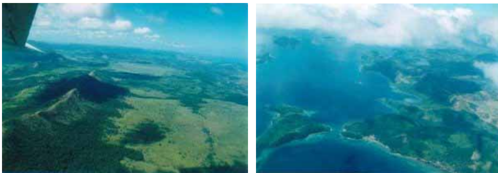
Bild links: die Ebene mit dem Flugfeld - Bild rechts: Coron (Küste Bildmitte)

Zwei deutsche Pärchen, einige Filipinos und ein Kampfhahn im Werte von 80'000 Pesos steigen aus, vier neue Passagiere steigen für die restliche Strecke nach El Nido zu. Wir erreichen die Nordspitze von Palawan. Diesmal sitze ich leider auf der falschen Seite. Zähneknirschend keine Aufnahmen machen zu können, blicke ich durch die kleinen Fenster auf meiner linken Seite und erhasche zwischendurch den Silberstreifen der Küste. Auch die Landung in El Nido ist ein kleines Erlebnis. Der Anflug erfolgt von der See her. Das Wasser unter uns kommt immer näher: 10 Meter, 5 Meter, 2 Meter, 1 Meter! Gibt es etwa eine Wasserung? Sekundenbruchteile später setzt der Pilot auf der Landepiste inmitten von Kokospalmen auf.