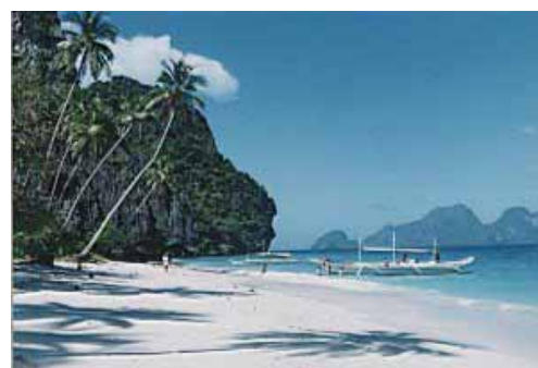
Die Beach von Intalula Island