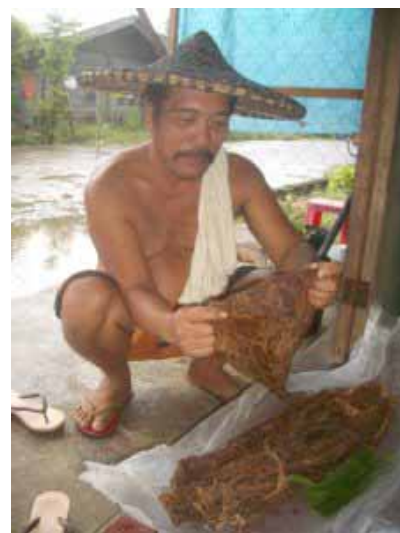
Diversifizierung: Hühnerfutter, Handy-Load und Tabakblätter