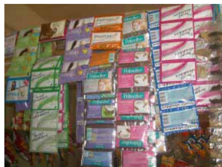
Sardinen, Milo, Nescafé und Schampoo