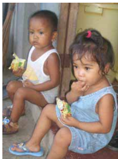
Die Kinder sind grosse Schleckmäuler

Grosse Gewinne gibt es nirgends, doch die Summierung vieler kleiner Gewinne ergibt am Schluss auch ein ansehnlicher Betrag. Obwohl im Sari-Sari die Preise um einige Pesos teurer sind als in der Grocery, kommen die Leute dennoch zu uns. Dies ist für mich erstaunlich, aber leicht erklärbar. Die Tatsache, dass der Filipino, auch wenn es sich