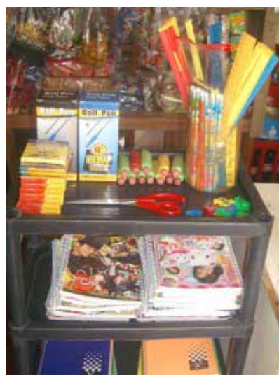
Ausbau des Ladens - Rechtzeitig zum Schulbeginn führen wir auch Schulmaterial