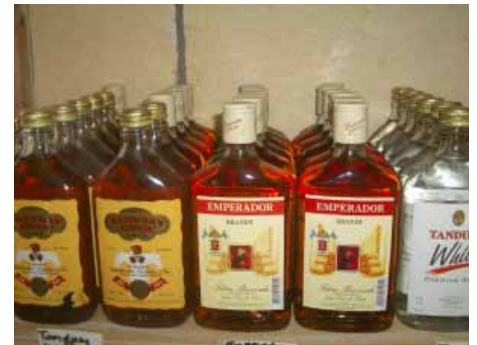
Alkohol und Zigaretten (trotz Warnung der Regierung) - ein gutes Geschäft