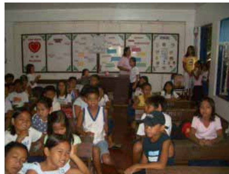
Ein Klassenzimmer der Elementary school in Maydolong