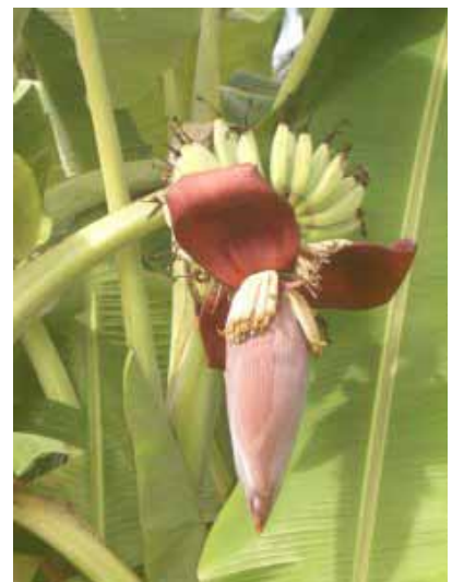
vlnr: Ampalaya (Bittergurken), Pepino (Gurken) und Bananenblume