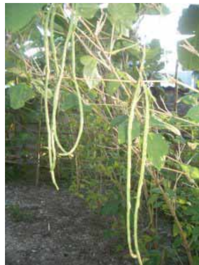
Ernte der Schlangenbohnen (sitaw)