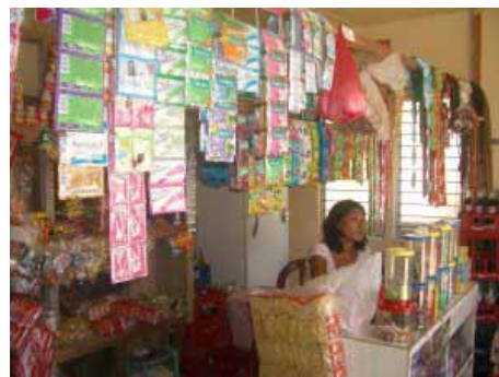
Aus dem Krämerlädeli ist längst ein Laden geworden