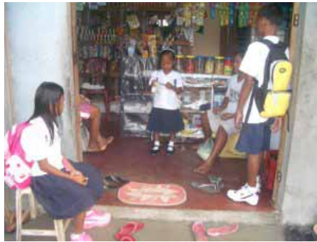
Bereit für den Schulanfang