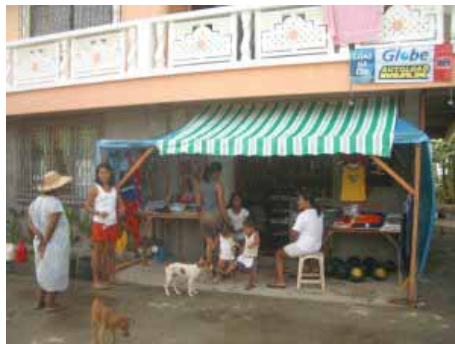
So sieht der Laden heute aus