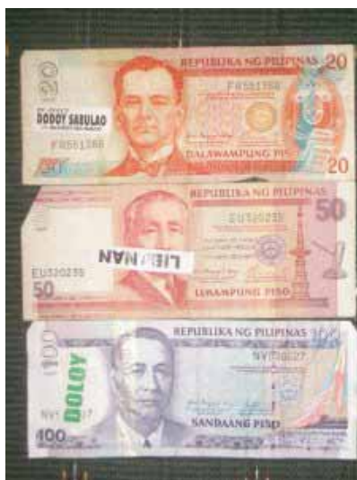
Banknoten mit seltsamen Klebern...