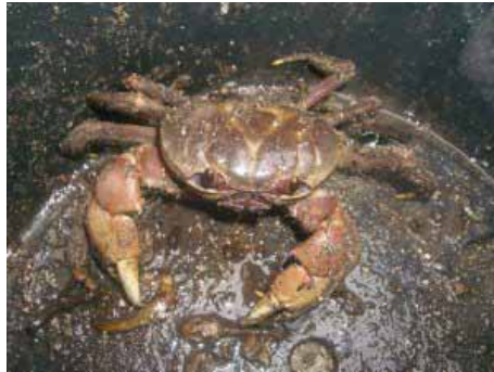
So sehen die "Gartentäter" aus

In der Abteilung „International“ gibt es leider weniger Erfreuliches zu berichten. Nüssler, Petersilie, Schnittlauch und Schnittsalat sind allesamt eingegangen. Die Tomaten wachsen prächtig und beginnen derzeit zu Blühen. Nach dem verwelken dörft jedoch der Stiel aus und die Blüte fällt ab ohne eine Frucht zu bilden. Hat jemanden eine Idee weshalb dies passiert?