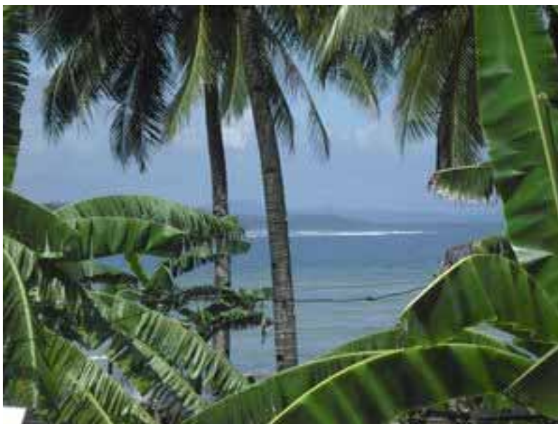
Sonntagmorgen, 09.00 Uhr: Blick vom Balkon auf den "noch" ruhigen Pazifik

Bessere Frühwarnsysteme wurden seither installiert. Dass ich sechs Jahre später persönlich mit einer Tsunami Warnung konfrontiert werden sollte, dies hätte ich mir nicht träumen lassen. So stehe ich an diesem wunderschönen Sonntagmorgen des 28. Februars um 08.00 Uhr auf der Terrasse unseres Hauses und blicke nachdenklich auf den azurblauen Pazifischen Ozean hinaus. In etwa fünf Stunden sollen die am Vortag beim Erdbeben in Chile ausgelösten Tsunami-Wellen hier die Küste erreichen! Wie hoch und stark werden sie sein? Ist unser Haus fünfzig Meter vom Meer entfernt in ernsthafter Gefahr? Dass hier in wenige Stunden die ganze Küste verwüstet sein könnte scheint so unrealistisch, dass man an so was gar nicht richtig glauben kann. In Sri Lanka, einige Tausend Kilometer vom Epizentrum des Erdbebens in Indonesien entfernt, wurde damals ein ganzer Zug durch die Wucht der Wellen aus dem Gleis gehoben und wie ein Spielzeug durch die Luft gewirbelt! Müssen wir das Haus evakuieren? Ich habe noch etwas Zeit um zu entscheiden.