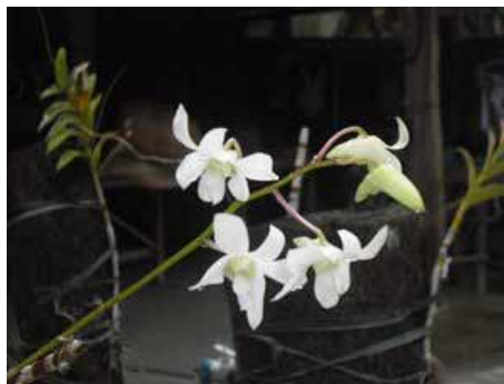
Die ersten Blumen...