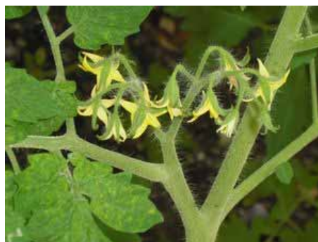
Die Tomaten: Ob die Blüten dieses Jahr auch wieder künstlich befruchtet werden müssen?