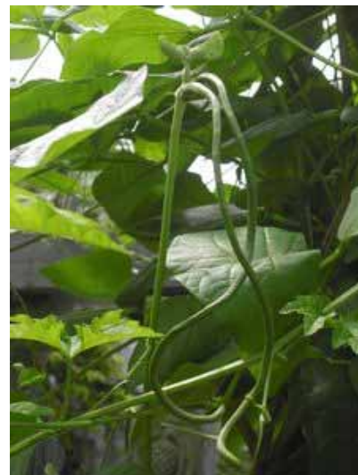
Das erste Gemüse ist geerntet: li Bittergurken (Ampalaya) - re Schlangenbohnen (Sitau)