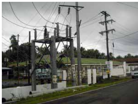
Eastern Samar Electric Cooperative (ESAMELCO)