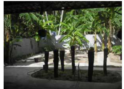
Das neue Trike- . Podpod- und Velo Garage - re der Orchideengarten