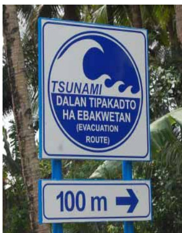
Evakuations-Tafel zwischen Balangkayan und Llorente bis zum 28. Februar oft belächelt!