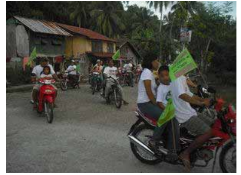
"Motorcades" in Maydolong