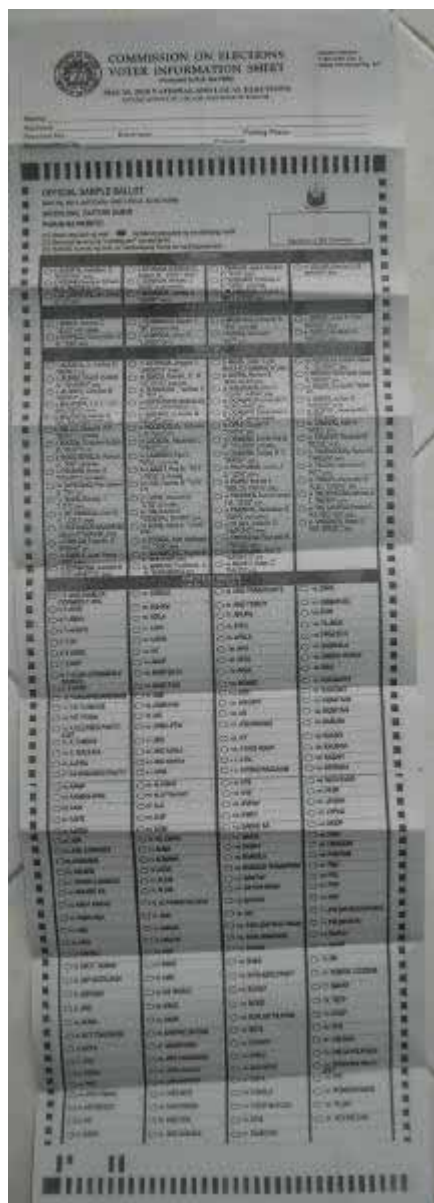
Vorderseite des Wahlformulars