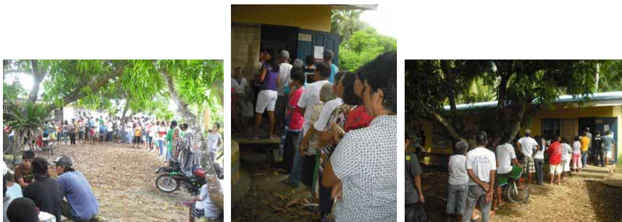
Das Wahllokal für Barangay 7