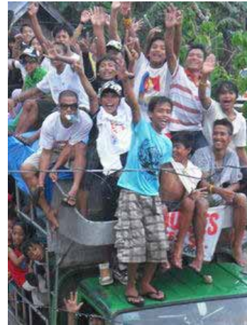
Wahlkampagne für den neuen Bürgermeister in Maydolong