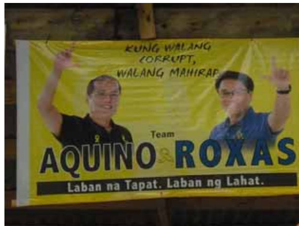
Senator Aquino und Roxas als Vize-Präsident