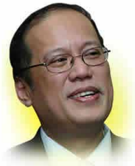
"Nonoy" Aquino, der 15. Präsident der Philippinen

Mittwoch, 9. Juni: Nun ist es Offiziell. Sieger der Wahlen vom 10. Mai ist Senator Benigno "Nonoy" Aquino III (50). Gehen wir jedoch chronologisch vor.