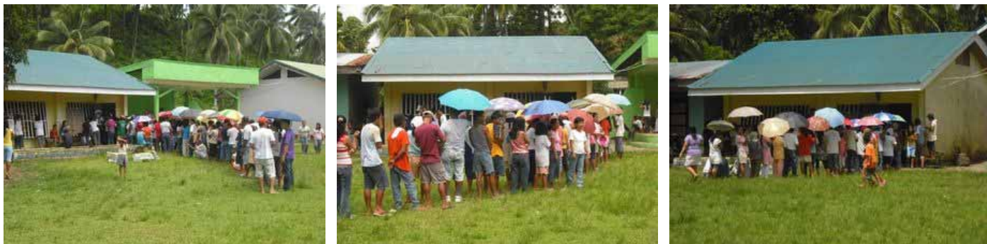
Lange Wählerkolonnen bei 35 Grad Hitze!

Zurück zu Hause, laufen die Wahlkommentare im TV auf Hochtouren. In der Zwischenzeit wurde bekannt, dass es landesweit etliche computer technische Pannen gab und dreihundertacht Zählmaschinen ersetzt werden mussten. Vereinzelt soll es auch zu Gewalttaten gekommen sein. Nach Polizeiangaben wurden mindestens sieben Menschen getötet und acht verletzt.