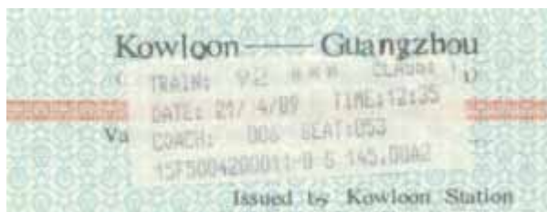
Ticket nach Guangzhou

21.04 Kowloon ab 12.50 Guangzhou an 15.30 (Sommerzeit – 1 Std)