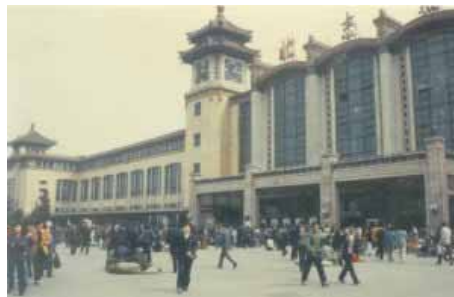
Bahnhof von Peking