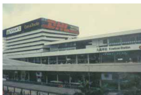
Kowloon Railway Station