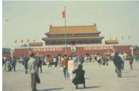
Peking: Tianmen Platz

23.04 Xinshan 21.45 Zhenzhou 01.55 Beijing an 11.50