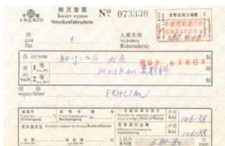
Das Zugsbillet nach Moskau