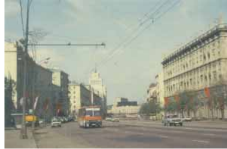
Ankunft in Moskau