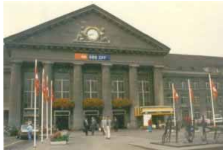
Ankunft in Biel