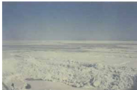
Der gefrorene Baikalsee

Anekdote: das Reisebüro in Bangkok hatte mir vorgeschlagen in Irkutsk einen Stopp zu machen um eine Bootsfahrt auf dem Baikalsee zu unternehmen!!