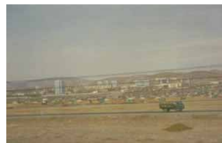
Fahrt durch Mongolien nach Ulan-Bator (Bild rechts)

27.04 Ulan-Bator Km 1561 an 13.20 ab 13.50 Suhbaatar Km 1940 an 21.00 ab 22.05 Nauski Km 1963 an 17.53* ab 20.25* * Moskau Zeit (- 5 Stunden)