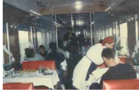
Bild links: Mitreisende meines Abteils - Bild rechts: der Speisewagen

29.04 Krasnojarsk Km 3761 an 02.52 ab 03.07 Speisewagen öffnet um 05.00 Novosibirsk Km 4522 an 14.50 ab 15.13