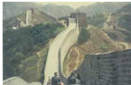
Ausflug zur Chinesischen Mauer