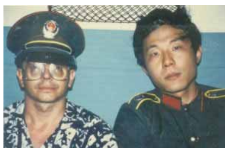
Freundschaft mit dem Schaffner

21.04 Guangzhou ab 21.35 22.04 Changsha 12.00 Wuhan 17.30