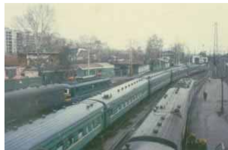
Bahnhof von Novosibirsk