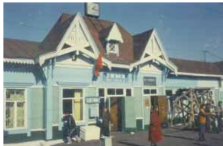
Bahnhof von Zyma

Anekdote: das Reisebüro in Bangkok hatte mir vorgeschlagen in Irkutsk einen Stopp zu machen um eine Bootsfahrt auf dem Baikalsee zu unternehmen!!