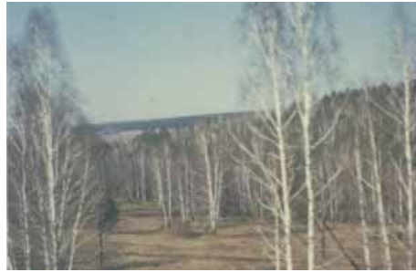
Die Strecke führt Tausende von Kilometer entlang von Birkenwäldern