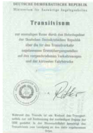
Transitvisum durch die DDR